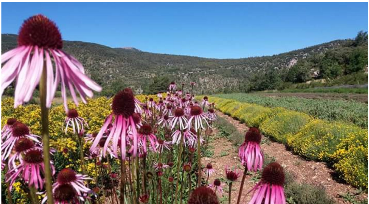
Equinàcia ( Echinacia purpurea ).

Sí que és cert. Hi ha una recuperació de l'interès per les plantes medicinals i d'assumir que, per a algunes afeccions, abans de tractar-nos amb medicaments farmacèutics, val la pena intentar solucionar-ho amb plantes, buscar-hi una solució més natural i, en definitiva, més beneficiosa per a la nostra salut. En aquest aspecte, però, els costums també han canviat. Ara s'acudeix a herbolaris, parafarmàcies o fins i tot farmàcies, buscant remeis